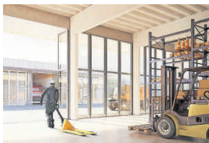
Scorcio sul futuro.

La Gestione comunque, nel suo rapporto stilato da Ferruccio Unterhändler (PLR) e firmato con riserva dai membri leghisti, «desidera biasimare il Municipio sulla sempre più dimostrata incapacità di riuscire a dare informazioni attendibili al Consiglio comunale, fosse non altro permetterlo in condizione di prendere delle decisioni con consapevolezzaza